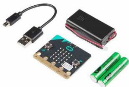
Carte programmable – 15 exemplaires