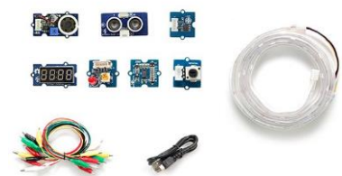
Lot de 10 capteurs et accessoires pour carte programmable - 4 exemplaires