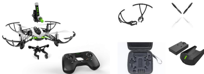
Pack Mambo mission et accessoires - 1 exemplaire